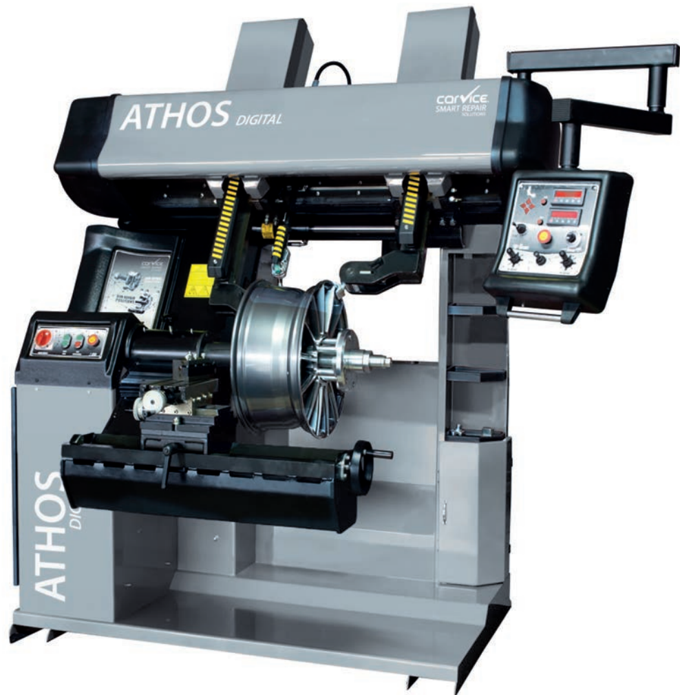
Abb.: mit optionalem Schnell-Spannsystem und Mini-Drehbank